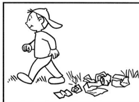
ABBANDONO LE CARTACCE SUL PRATO