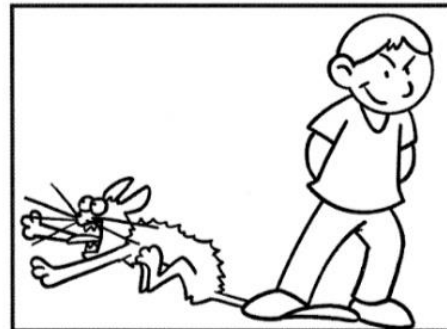
FACCIO DISPETTI AGLI ANIMALI