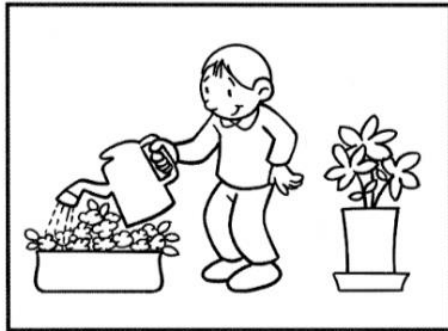
INNAFFIO I FIORI