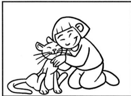
RISPETTO GLI ANIMALI