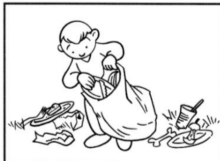
RACCOLGO I RIFIUTI DOPO IL PIC-NIC