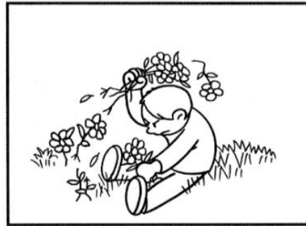
STRAPPO I FIORI