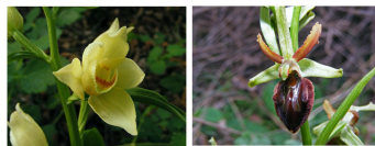
Cephalanthera damasonium relatore Ophrys sphegodes

Giovedì 18 maggio 2017 ore 20.30 Sala Centro Civico n. 2 - Via De Nicola 8